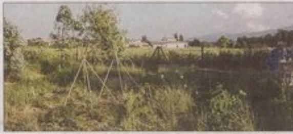
Jardin partagé en permaculture de Lucciana.

Concrètement, la permaculture repose sur l'idée que le jardin se suffit à lui-même, ou presque : les interactions entre les plantes, l'apport de la moindre quantité possible d'eau, l'absence d'engrais ou de pesticides chimiques, la récupération des déchets sont les seuls principes concrets à appliquer pour pratiquer la permaculture. Pour le reste, les jardiniers essaient, tâtonnent, s'ins-